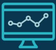
Tabla de índice de cumplimiento