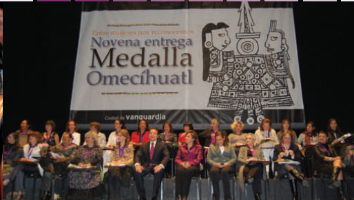
Novena entrega Medalla Omecihuatl