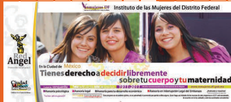
Campaña institucional 2011, exhibido sistema METRO