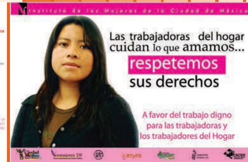
Campaña Familias Diversas y Trabajo Doméstico