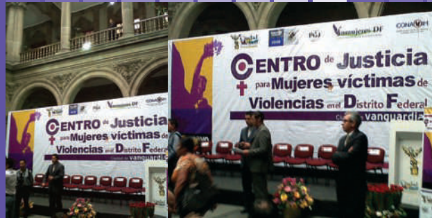
Centro de Justicia para Mujeres Víctimas de Violencia en el Distrito Federal