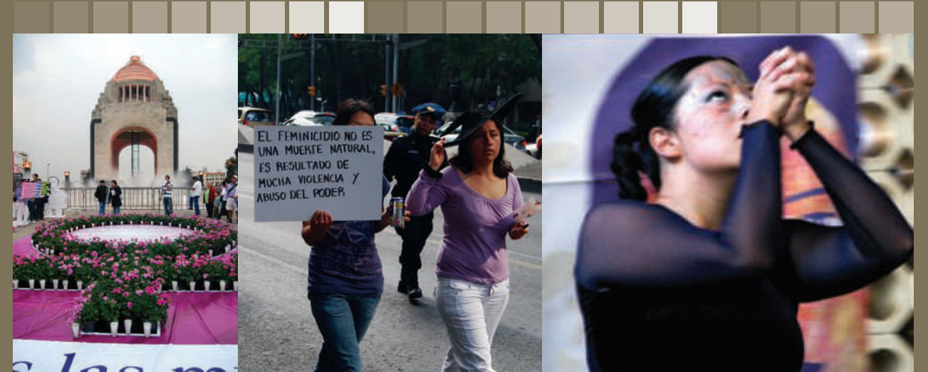
Feria 8 de marzo, Día Internacional de las Mujeres

Finalmente, se orientaron diversas sesiones del Grupo Estratégico al análisis y diagnóstico de las necesidades específicas de las personas adultas mayores víctimas de violencia familiar y el impacto de las recientes reformas penales en este sector de la población.