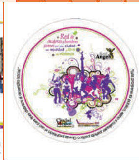
Materiales Red de mujeres y hombres jóvenes por una ciudad con equidad y libre de violencia