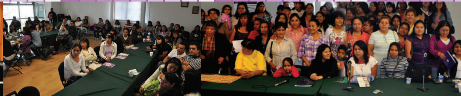
Trabajadoras del hogar