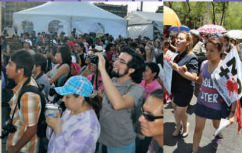
Feria Amores sin violencia, Monumento a la Revolución