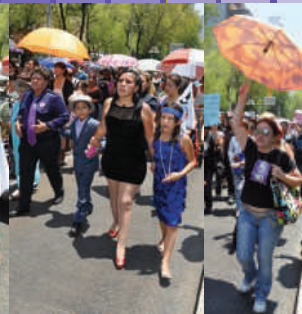
Marcha contra la violencia hacia las mujeres (Evento de la Sociedad Civil)