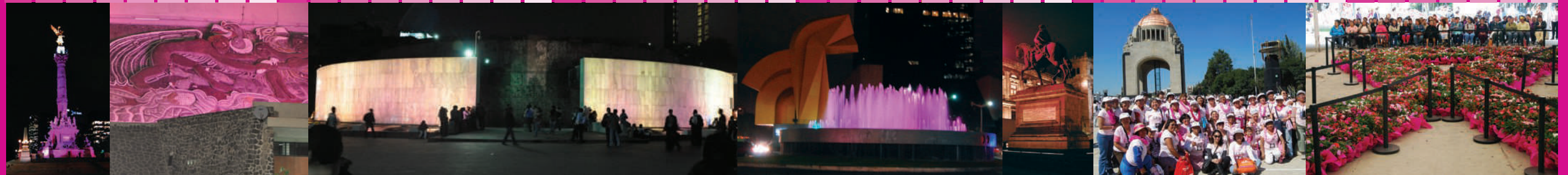
Iluminación de monumentos de rosa, Día Internacional de Lucha contra el Cáncer de Mama