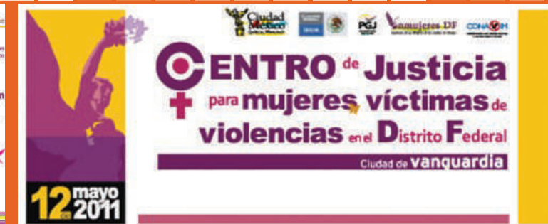
Imagen Centro de Justicia para las Mujeres Víctimas de Violencia en el DF