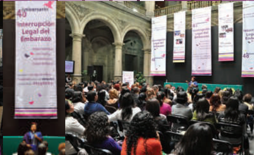
4to. Aniversario ILE