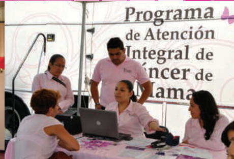
Atención en Unidades Móviles