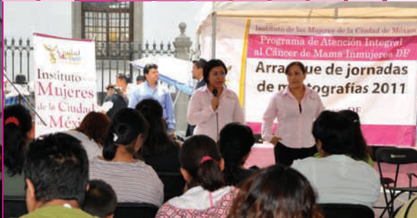
Plática sobre autoexploración