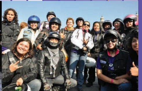
1a. Rodada por el derecho de las mujeres a una vida libre de violencia