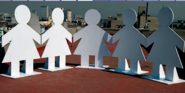
Ciudades Seguras para las Mujeres