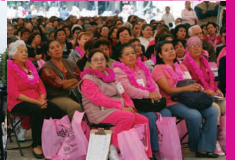
Entrega de mastografías