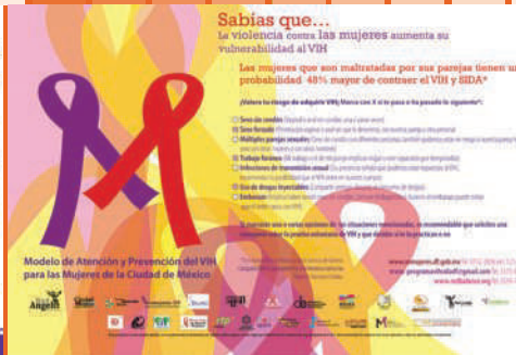
Campaña Modelo de Atención y Prevención del VIH para las Mujeres de la Ciudad de México