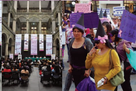
Marcha contra el Feminicidio