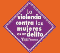
Imagen campaña Ciudades Seguras y Libres de Violencia para las Mujeres