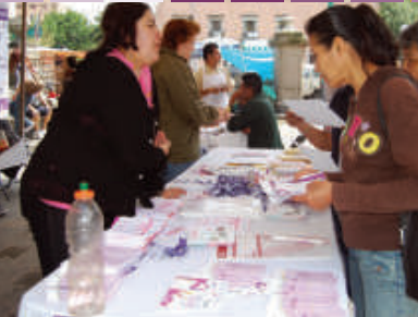
Feria del Día Internacional contra la Violencia hacia las Mujeres