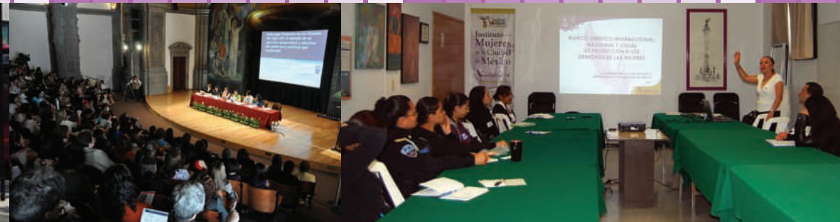
Capacitación a funcionarias y funcionarios públicos