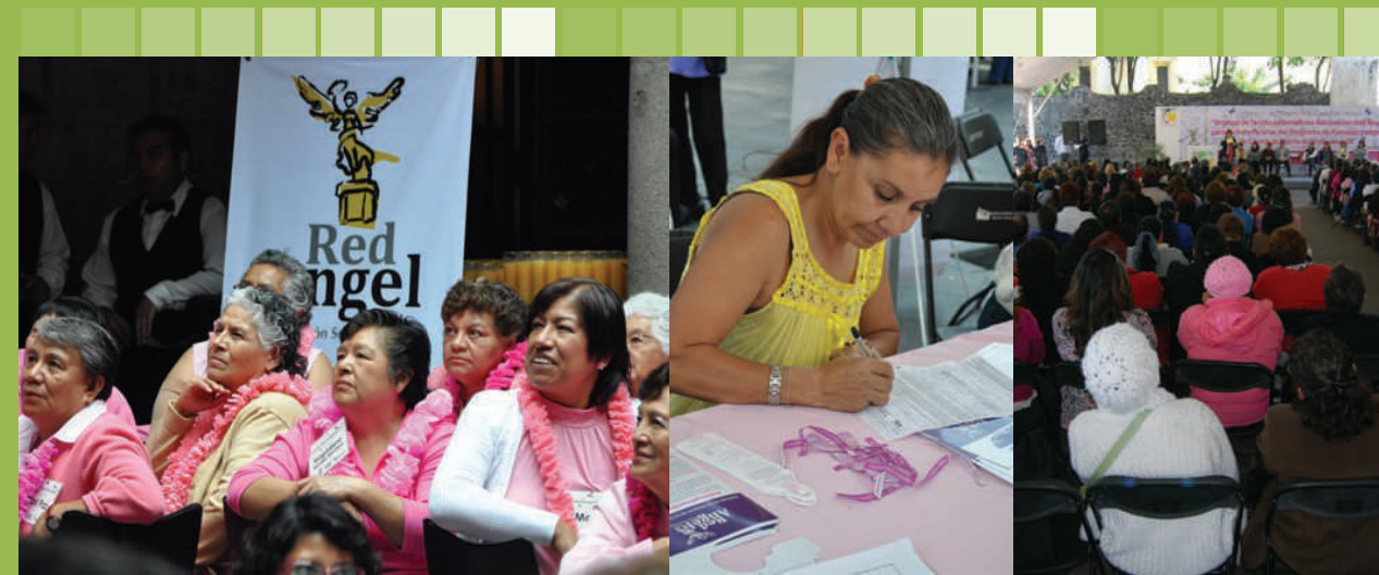
Grupo de mujeres Red Rosa contra el cáncer de mama

A partir de agosto de 2011, el InmujeresDF comenzó la entrega de tarjetas Red Ángel. Al mes de diciembre de 2011 se habrán entregado más de 50 mil tarjetas.