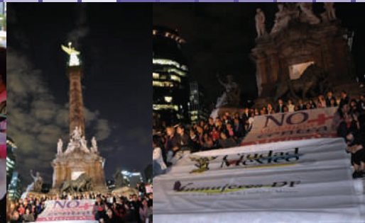
Luces de esperanza, Monumento a la Independencia