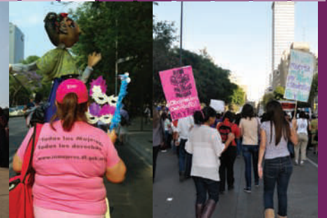
Marcha, 8 de marzo