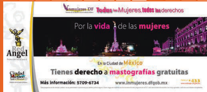
Campaña Mastografías Gratuitas 2011, exhibido sistema METRO