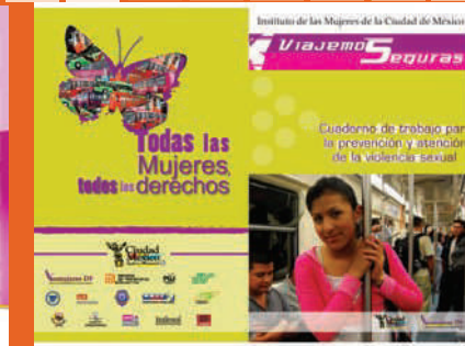
Materiales Programa Viajemos Seguras en el Transporte Público de la Ciudad de México