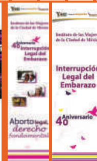
Imagen ILE 4to. Aniversario