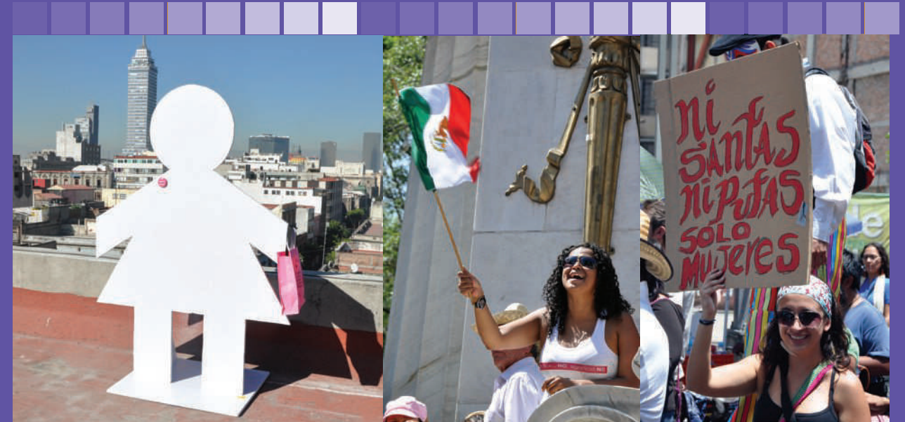
Ciudades Seguras para las Mujeres

Asimismo, como parte de la atención a mujeres en situación de mayor vulnerabilidad, el InmujeresDF elaboró el folleto informativo denominado “La Trata de Personas, el Abuso Sexual y la Explotación Sexual comercial de Niñas, Niños y Adolescentes”.