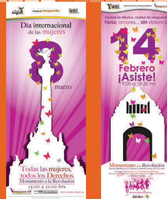
Imagen 14 de febrero y 8 de marzo

Los servicios del Centro beneficiaron a 1,509 personas (usuarias internas y externas , 1,300 mujeres y 209 hombres).