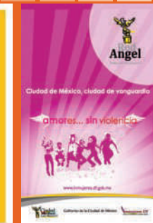
Materiales Red de mujeres y hombres jóvenes por una ciudad con equidad y libre de violencia