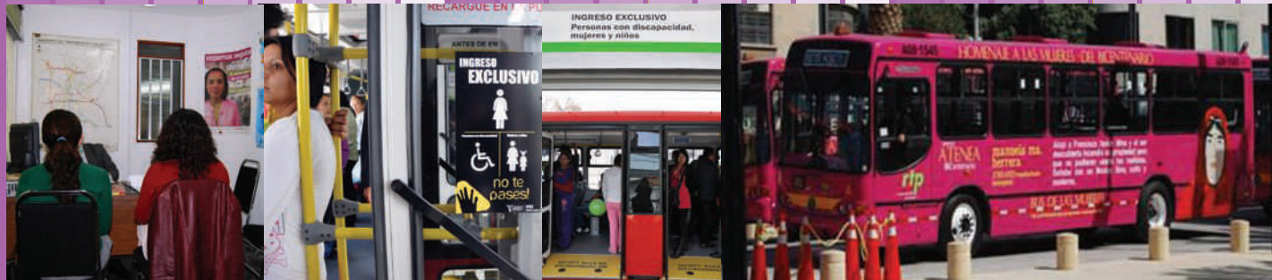
Programa Viajemos Seguras en el Transporte Público