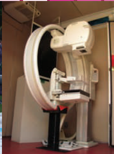
Mastógrafo en Unidad Móvil