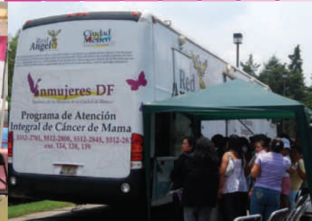
Atención en Unidades Móviles