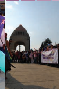
Feria, 8 de marzo