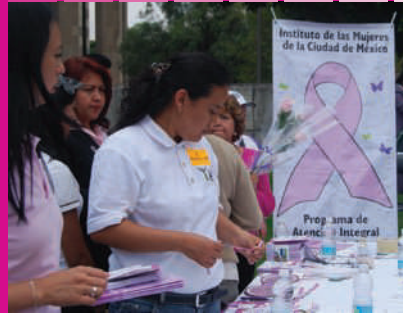
Prevención del cáncer de mama