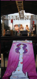
Feria, 8 de marzo