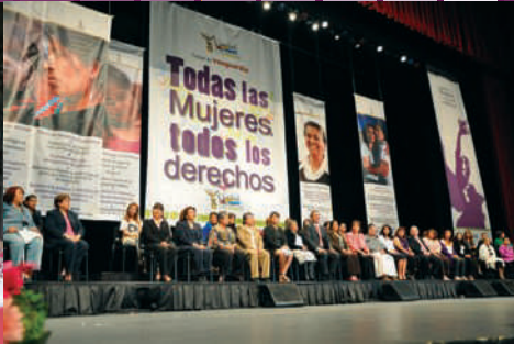
Auditorio Nacional, 8 de marzo