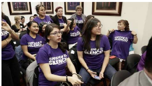
Mujeres mexicanas víctimas de tortura sexual en San Salvador Atenco en 2006, durante las audiencias públicas en la Corte IDH.

De acuerdo con la Entidad de Naciones Unidas dedicada a promover la Igualdad de Género y el Empoderamiento de las Mujeres, ONU Mujeres, durante los últimos 25 años los conflictos y las crisis humanitarias se han vuelto más complejos, violentos y prolongados. Empero, las mujeres y las niñas tienen un papel fundamental que desempeñar, son las primeras en responder y asumir nuevos roles al interior y exterior de los hogares.