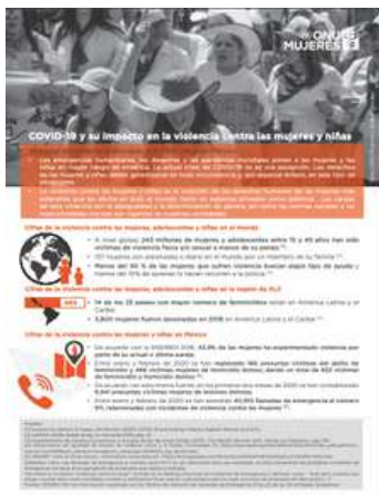
Clasificación: Archivo digital

Este documento enumera algunos de los desafíos de la política macroeconómica para seguir avanzando en la mitigación de los efectos de la crisis; como expandir el espacio fiscal, financiamiento de emergencia a las instituciones financieras internacionales, condonación y el alivio del servicio de la deuda y revisión de las leyes de responsabilidad y reglas fiscales procíclicas.